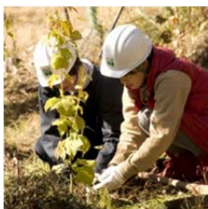
ウリハダカエデの植樹