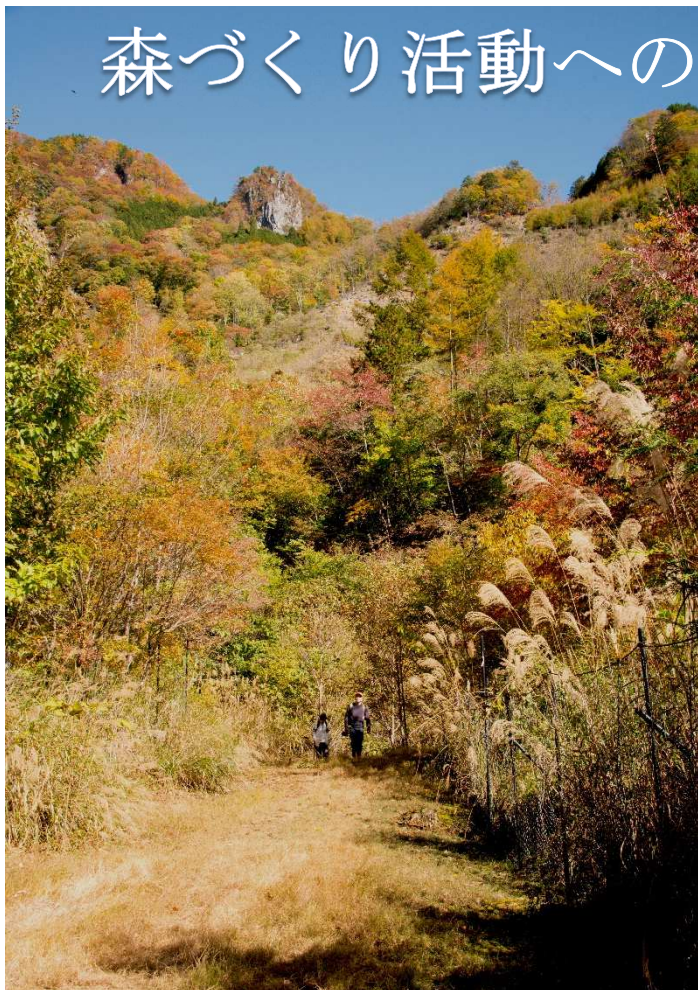
県有林山吹沢植栽地

秩父地域は、その面積の87%を山林が占めています、林業の衰退で山森の荒廃がすすんで危機的な状況です。荒れた森を何とかしたい、森を活用したいと活動をはじめました。森で種を採取し苗を育て、そして植樹、下草刈りを行い大切に育てています、20年以上たつてようやく森らしくなります。長い時間と手間のかかる私たちの活動は多くの皆様から寄せられるご支援・ご協力によって支えられています。これからも続く、苗づくりに、そして《未来へつなぐ森づくり》へご支援・ご協力をお願い申し上げます。